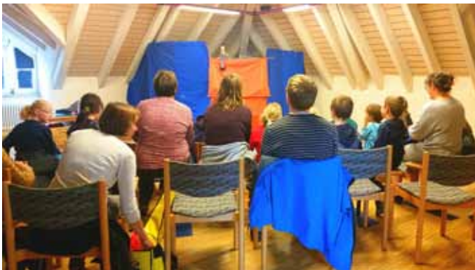
Gespannt hören Kinder und Eltern dem Kasperle zu.