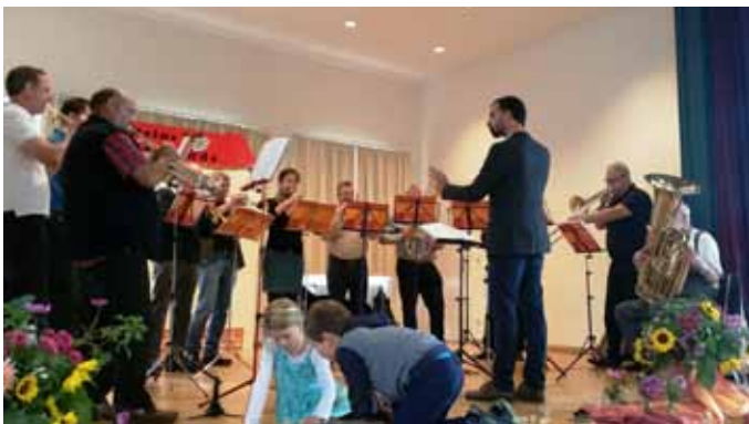
Der Posaunenchor unter neuer Leitung