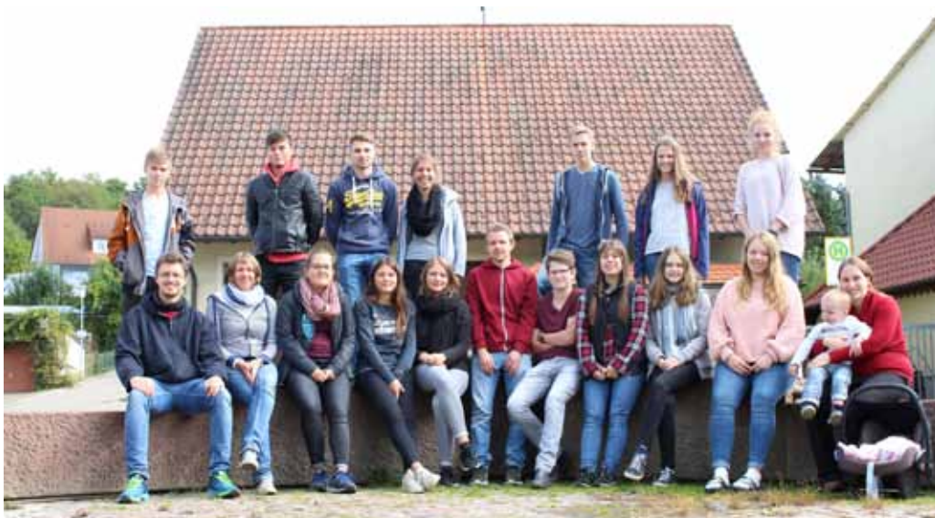
Die Teilnehmenden der Mitarbeitendenfreizeit