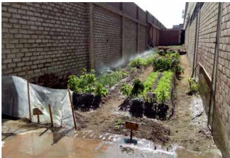
Ein Teil des Schulgartens