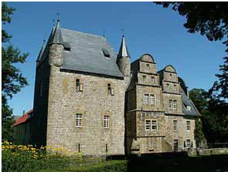
Die Schelenburg bei Osnabrück