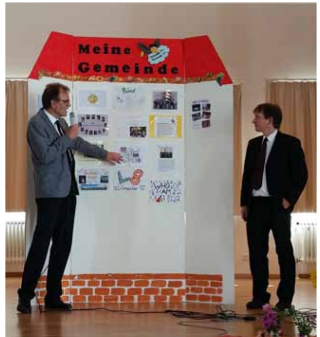
Viele „lebendige Steine“ bauen das Haus Gemeinde.