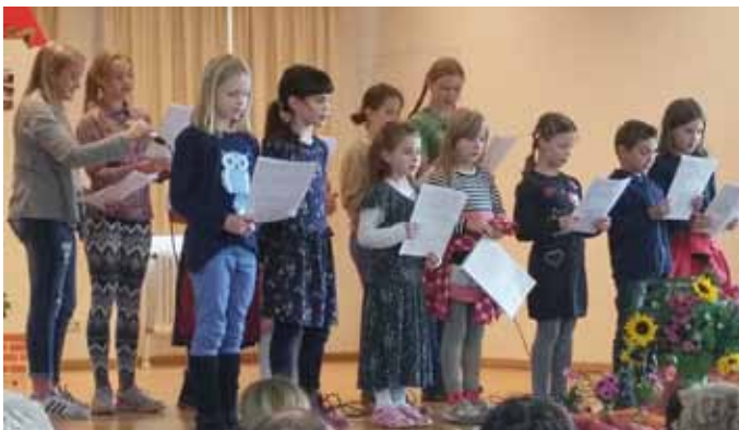
Der Kinder- und Jugendchor unterhält die Gemeindefestbesucher mit Liedern aus einem Martin-Luther-Singspiel.