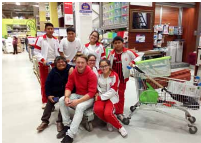
Beim Einkauf im Baumarkt mit den Spenden vom Benefizkonzert