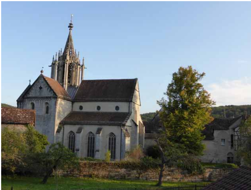
Klosterkirche Bebenhausen mit „Lutherlinde“ – gepflanzt zum Reformationsjubiläum 1817

Luther war jedoch nicht nur der kongeniale Übersetzer der Heiligen Schrift, sondern auch ein ebenso kongenialer Liederdichter und -komponist. Viele seiner Lieder sind bis heute im Evangelischen Gesangbuch und einige auch im katholischen Gotteslob zu finden. Deshalb erklingen passend zu den Lesungen die bekannten Lutherlieder „Ein feste Burg“, „Nun komm, der Heiden Heiland“ oder „Verleih uns Frieden gnädiglich.“ Das Tübinger Instrumental- und Vokalensemble Chanter schlägt mit Harfe, Flöten und Saiteninstrumenten die Brü-